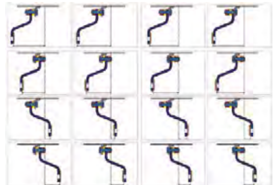
Diagram illustrates the possible arrangements of wheel, disc and spacer to achieve 16 wheel offsets.